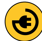
2,5 m length

EN Models with cable are available for those who want to work at maximum brightness and unlimited autonomy.