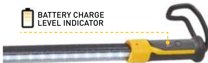
BATTERY CHARGE LEVEL INDICATOR

CHARGING TIME: 4 h CHARGER: 100/240V @ 50/60HZ